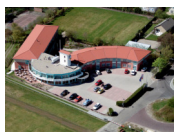
Fletcher Duinhotel Burgh Haamstede **** (Burgh Haamstede) www.duinhotelburghhaamstede.nl

Bij het selecteren van de hotels proberen wij zo veel mogelijk rekening te houden met een veilige afgesloten fietsenstalling. Echter kunnen we dit niet bij alle hotels garanderen en is dit mede afhankelijk van het aantal fietsen van andere hotelgasten.