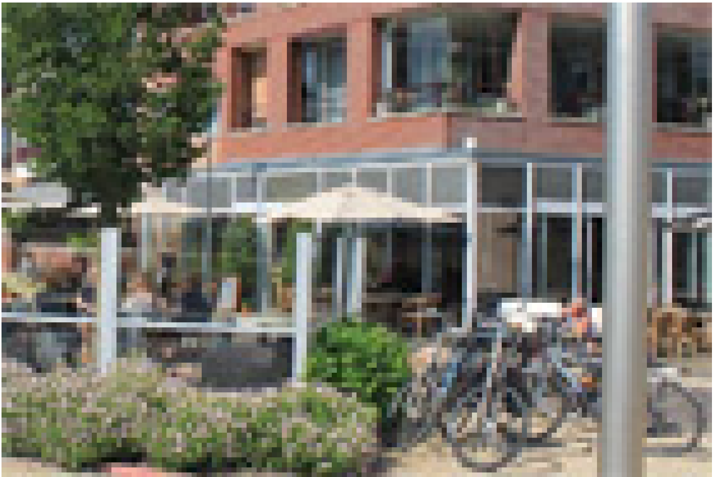
Stadshotel Doesburg*** (Doesburg)