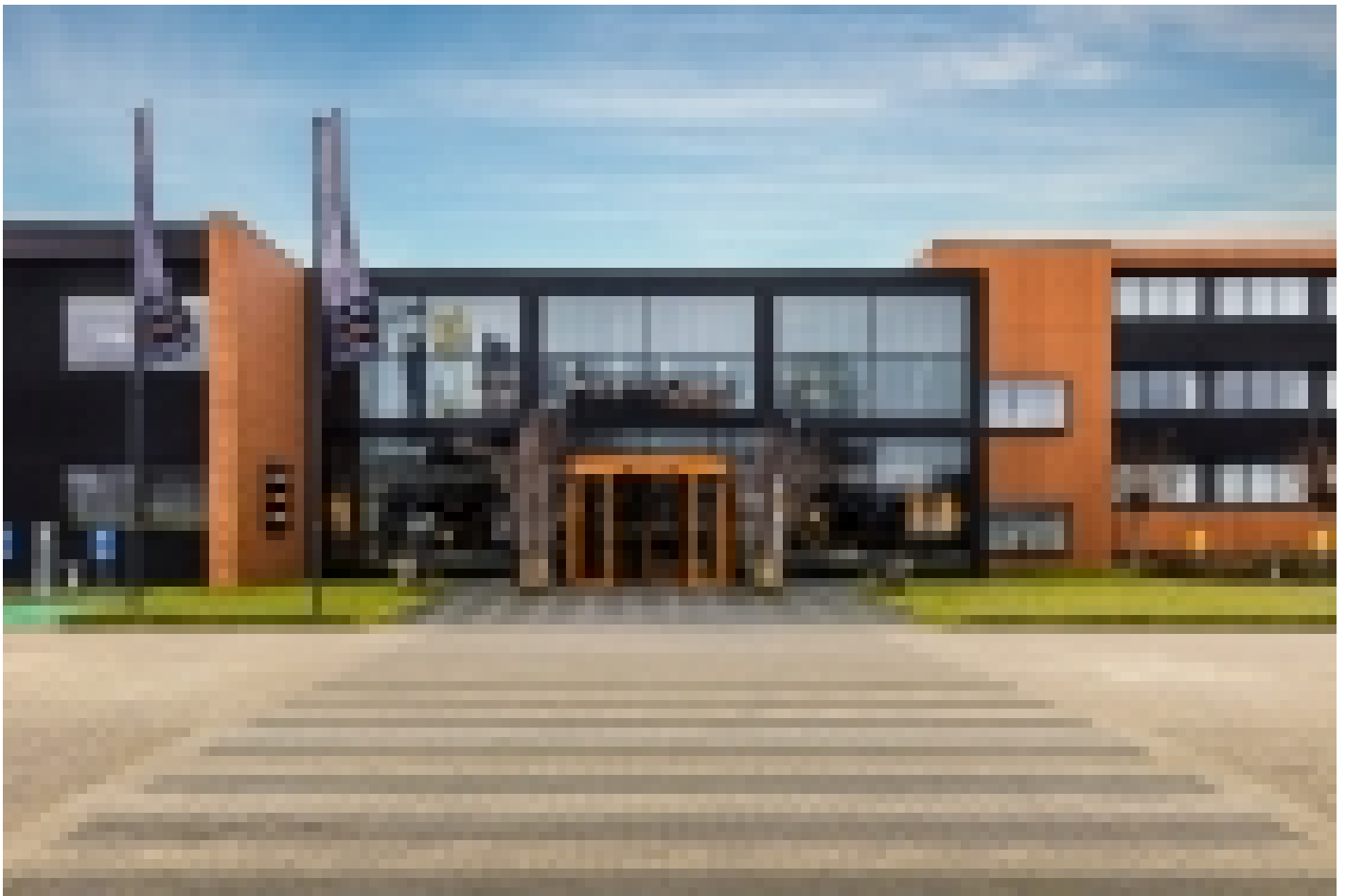
Postillion Deventer**** (Deventer)