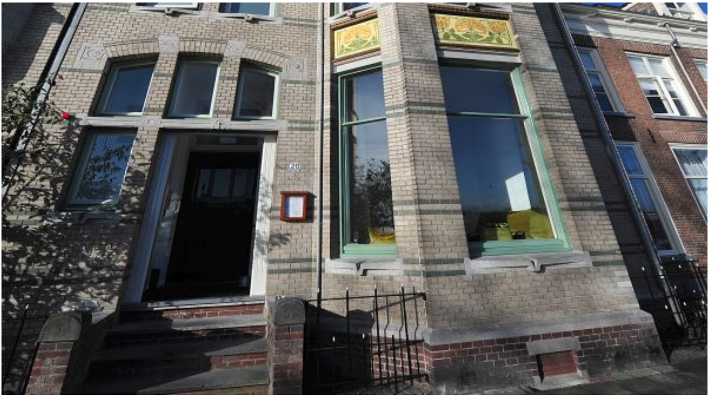
Boetiekhôtel Kampen (Kampen)