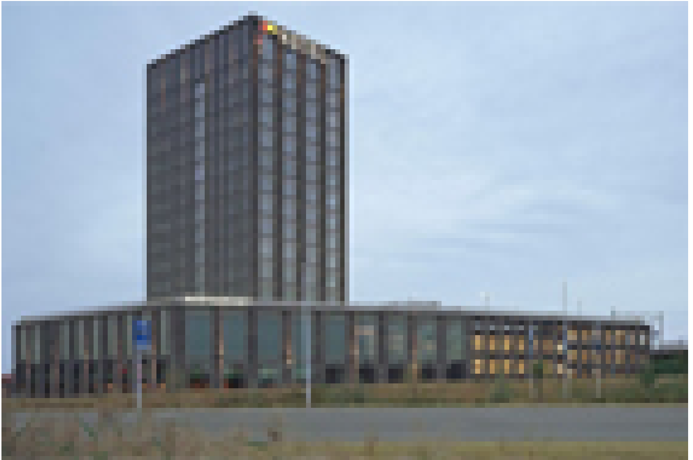
Van der Valk Hotel Nijmegen-Lent**** (Nijmegen-Lent)

Hieronder staan de accommodaties die wij standaard boeken voor deze reis. Ze zijn zorgvuldig door ons geselecteerd en ingesteld op fietsers. Alle kamers zijn voorzien van douche of bad en toilet. Mocht één van de hotels zijn volgeboekt, dan proberen wij een vergelijkbaar alternatief te boeken waar mogelijk. Bij het selecteren van de hotels proberen wij zo veel mogelijk rekening te houden met een veilige afgesloten fietsenstalling. Echter kunnen we dit niet bij alle hotels garanderen en is dit mede afhankelijk van het aantal fietsen van andere hotelgasten.