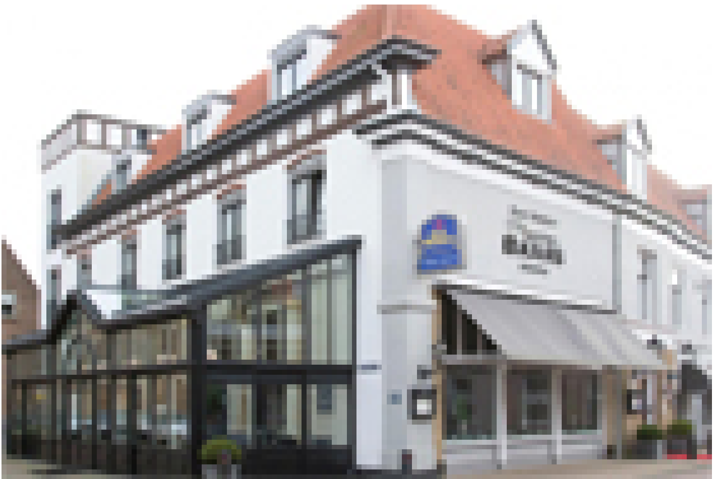
Best Western Baars**** (Harderwijk)

www.bestwestern.nl/best-western-hotel-baars